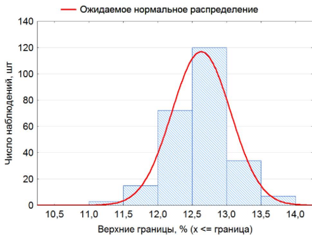
Рис. 1. Гистограмма концентраций марганца

Как видно, распределение марганца стремится к нормальному, что свидетельствует о высокой однородности содержаний марганца в сталях. Таким образом, вышесказанное свидетельствует о высокой профессиональной подготовке сталеваров и удовлетворительной технологической дисциплине на участке плавки.